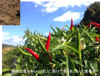
自然の恵みをいっぱいを受けて赤くついた唐辛子