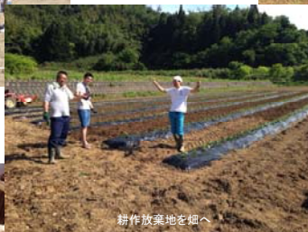
耕作放棄地を畑へ