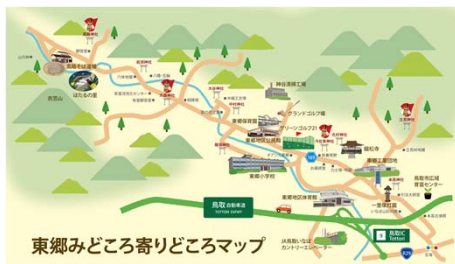
(当法人作成マップ)