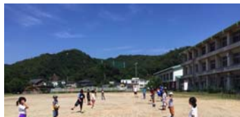
広い校庭をいっぱいに使ったサッカー