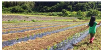
順調に発育している唐辛子の苗