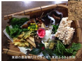
東郷の農産物だけで作上げた東郷ふるさと弁当